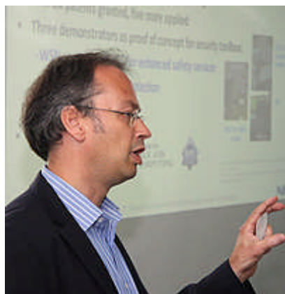
Die Vorträge - hier ein russischer Wissenschaftler - wurden simultan übersetzt